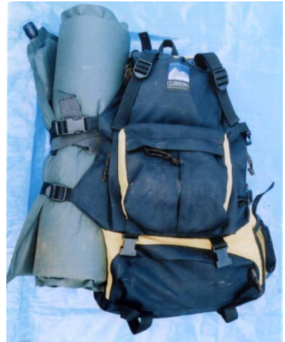
リュックサック（黒・黄色）、 エアマット