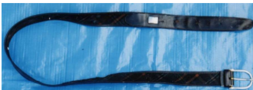
ベルト（ダンヒル製）