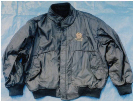
ジャンパー （黒色、Japan Open golf championship製）