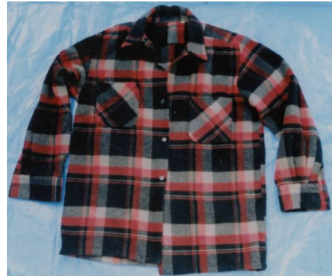
シャツ（赤と黒色チェック柄）