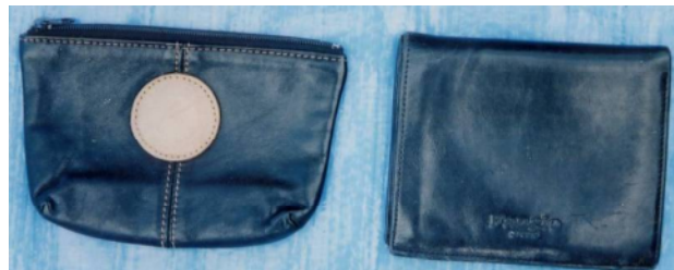
小銭入れ（黒色、MOTOMACHI YOKOHAMA）、 財布（黒色）