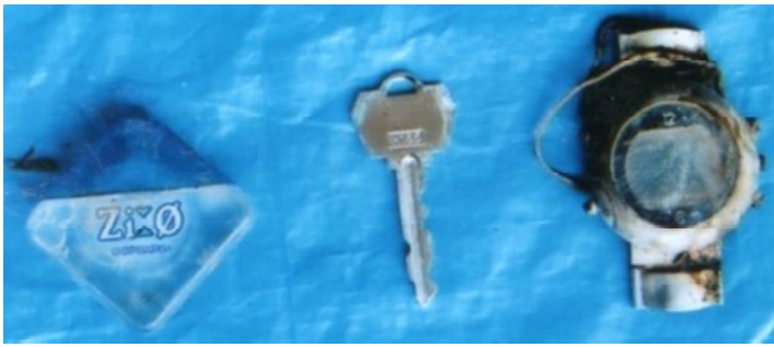
目薬、鍵、腕時計（デジタル、丸型）