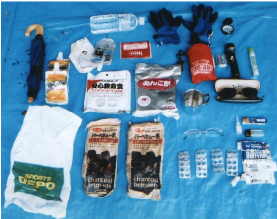
コンパス、サングラス（レイバン）、雨傘、眼鏡（銀縁）等