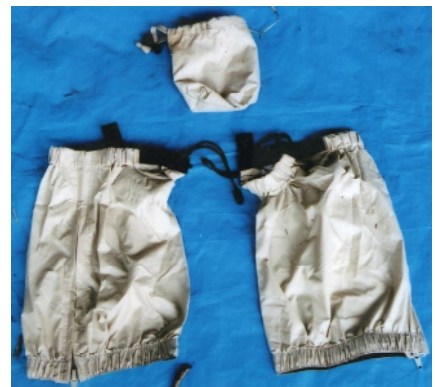
レッグカバー (ベージュ色)