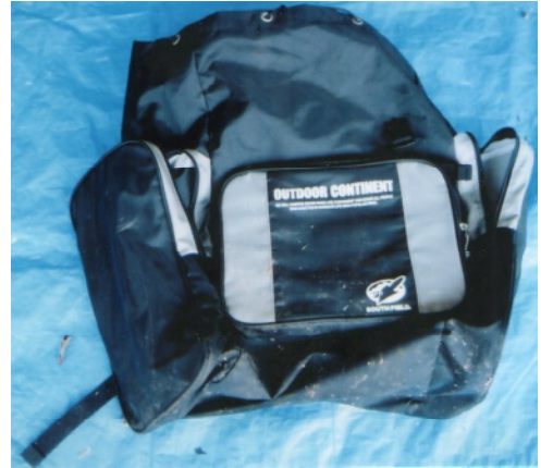
リュックサック (黒色、OUTDOOR CONTINENT製)