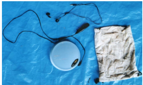
C Dウォークマン (SONY製)