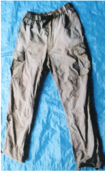
ズボン (ベージュ色、THE NORTH FACE製)