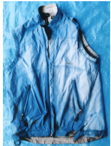
ベスト(水色、サイズM)