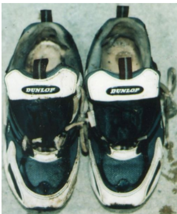
運動靴(青と白色、ダンロップ製、24.5cm)