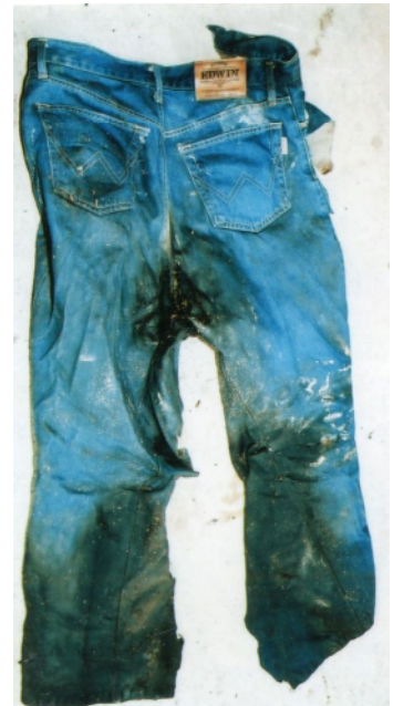
ジーパン(紺色、エドウィン製)