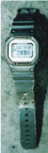
腕時計（カシオGショック、灰色、デジタル型）