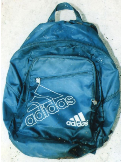
リュックサック（青色、アディダス製）