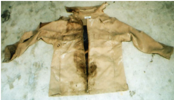
ジャンパー(ベージュ色、サイズM、レノマ製)