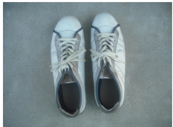
白色運動靴 (25.0 cm)