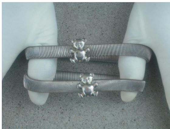
銀色アームバンド