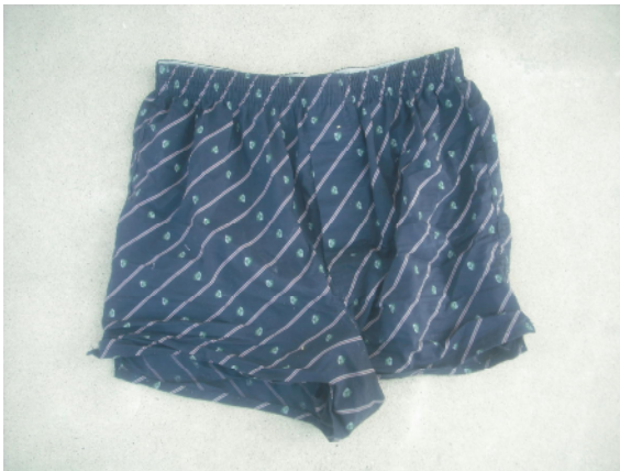
黒色トランクス(ユニクロ)