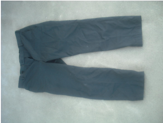
黒色長ズボン (ユニクロ)