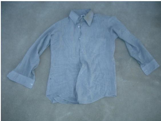
灰色長袖カッタ - ( D A I M A R U )