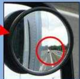
補助ミラーでは真後ろの 緊急車両を確認できる。