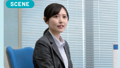
SCENE 高校卒業と同時に岐阜県警察採用。交番勤務等を経て人身安全対策課初動支援係へ、事案発生時の現場対応や被害者のケアなど広範囲に対応しています。

幼い頃から、警察官である父親の正義感あふれる姿を見て育ちました。事件捜査や被害者支援において、女性ならではの感性が活かされると感じ、警察官を目指しました。警察官採用試験に合格した時は、家族全員が喜んでくれ、うれしかったことを覚えています。今はDVやストーカー、児童虐待事案等の初動捜査を支援する係で勤務しています。