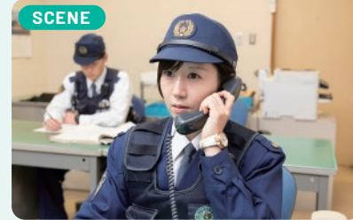
SCENE 私自身が被害にあった経験から警察官になろうと決めた背景もあり、被害者や相談者の気持ちに寄り添うようにしています。

私が警察官を志したきっかけは、大学時代のつきまとい被害です。その時対応してくれた警察官達がとても親身で頼もしく見え、私も誰かの役に立てるこんな仕事がしたいと思い警察官になりました。この経験から現在の交番勤務でも、助けを求める女性等の支えになるよう心掛けています。