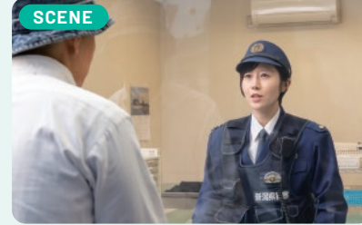
SCENE 女性ならではの気配りや心遣いなどが求められるケースも多いので、先輩からアドバイスをもらい、より安心感を与えられるように努めています。

現在は、交番勤務員としてパトロールや事件・事故の初動捜査等を行っています。非常に地域に密着した業務であり、生活に関連した相談等の対応後に感謝されたり、子ども達から敬礼されたりするとうれしく感じますし、もっと頑張ろうとやる気が出ます。