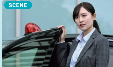
SCENE 今後は、より多くの捜査に携わることで「あなたに対応してもらってよかった。」と言われてもらえるような存在になりたいです。

警察官になったばかりの頃は、被害者から上手に話を聞き出せず、コミュニケーション能力に自信がありませんでした。しかし、様々な経験を重ねるうちにパニックに陥っている被害者からでも話を聞くことができるようになり、コミュニケーション能力の向上を感じています。これからも被害者に寄り添ったコミュニケーションを心掛けたいです。