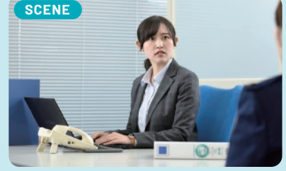
SCENE 女性や子どもが被害者になるケースが多いため、女性警察官の存在は重要です。そのような被害者の対応には保護対策を第一に考えています。

人身安全関連事案は、一歩間違えると命の危険につながりかねませんので、初動の段階から他部署と連携を図り様々な事案に対応しています。命を守る最優先の策を常に考えています。感謝の言葉をかけていただける機会も多く、そのような時はうれしい限りです。