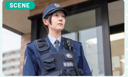
SCENE 巡回連絡や事件事故対応など地域の安全安心を守る交番の警察官は、地域住民との距離も近いので、頼りにされていると感じますね。

被害に遭われた女性や子ども、お年寄り、動揺を隠せないことが多いです。女性ならではの視点による対応で安心させ落ち着いてもらうことが、その後の捜査協力につながると考えています。誠実に接することで信頼してもらい、地域に元気を与えられる存在になりたいと日々奮闘しています。