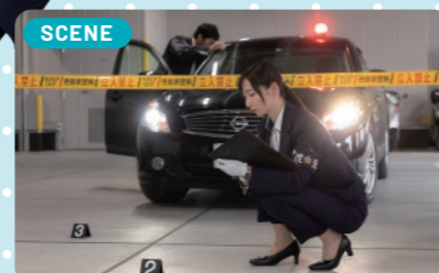
想像していたよりも仕事の幅が広く、刑事になってからは特殊詐欺や暴力団関係、薬物銃器の事件捜査を担当しています。

警察官になる前は、犯人を捕まえればいいという考えでしたが、いざ現場に立つと、検挙のために多様な専門知識を習熟することの重要性や「まずは事件を抑止する」ことの大切さを痛感するようになりました。仲間と取り組んで事件を解決したときは達成感がありますし、被害者からの「ありがとう」は私の宝物です。