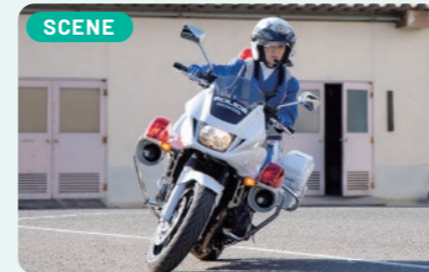
危険を伴う仕事なので技術の向上は欠かせません。訓練は厳しいですが、現在は日本中で多くの女性白バイ隊員が活躍しています。

幼いころから習っていた空手で、「誰かを守ること」の大切さを学びました。交通事故で失われる命を守りたい、それが白バイ隊員を目指して警察官採用試験を受験した理由です。採用試験に合格した時は、家族みんなが喜んでくれました。