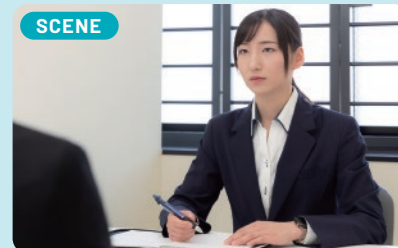
取調べは刑事の真価が問われます。難事件の被疑者と対峙することもあります。粘り強く事件の真相を明らかにしていきます。

警察学校卒業後、交番勤務でまず思ったことは「こんなに色々な事案があるのか」ということでした。事件はもちろん、阿波踊りの警備や迷子対応など生活のあらゆる場面に警察は関わっており、驚きの連続でした。その後、今の刑事課に異動し、違法薬物や銃器などの取締りに当たっています。