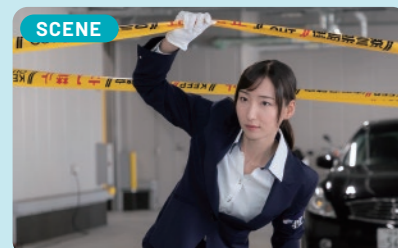
事件検挙のためにチーム一丸となって奔走する姿を見て私も刑事になりたいと思い、交番勤務を経て念願の刑事になりました!

私が警察官を目指したきっかけは少し変わっていて、中学生の頃、陸上部監督に「あなたは警察官に向いている」と勧められ警察官を意識し始めました。高校生になって警察官になりたいという想いを深め、採用試験に臨み合格、18名の同期と出会いました。私が警察官になったことを家族も喜んでくれましたね。