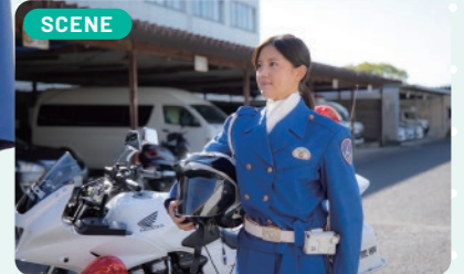
白バイ乗務中は、常に緊張感を保つとともに、ひとつひとつの行動に責任感を持つことを意識しています。

交通違反の取締りの場面では、違反事実やその危険性を冷静に伝えるように心がけています。違反や危険性に気付いていないドライバーも多く、私の説明を受けて「事故にならなくてよかった」と違反による危険性を理解してもらえたときは、交通警察官として大きなやりがいを感じます。