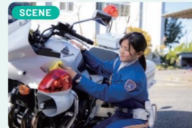
白バイは約300kg(リ)ありますが、コツさえ掴めれば小柄な女性でも起き上がらせることができます。走れば走るほど愛着が湧いてきます。

毎年「全国白バイ安全運転競技大会」が開催され、各都道府県警察の代表がその技術を競っています。私は奈良県警察の女性代表として、この大会での入賞に向けて毎日特訓しています。ここで培った技術を交通事故の抑止など、交通安全のために役立てていきます。