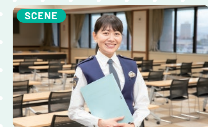
これまでは、総務・警務部門での勤務が長いこともあり、今後は事件捜査にもチャレンジしていきたいですね。

警察で働いていて一番感じることは「女性も安心して一生働ける」ことです。現在3人の育児をしていますが、公私ともにサポートが充実しており、安心して仕事に育児に取り組んでいます。採用同期の女性は、20年以上経った今でも全員が在職し、各分野で活躍しています。