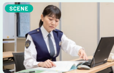
警察官になるには特別な才能や体力が必要といったことはなく、人に寄り添う優しい気持ちが一番大切だと思います。

現在は、警察署で地域住民からの警察相談の窓口対応をしています。迷惑メールや家庭内トラブルなど事案は様々ですが、緊急を要する案件もありますので、常に気は抜けません。警察部内や関係機関と連携し、事件等に発展する前に解決できるように努めています。