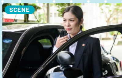
花形のイメージがありますが、実際は現地視察や日程・段取りなどの調整が多く、従事する全員の認識を一致させなければならぬなど難しい面がありますね。

現在の仕事は、要人警護です。直前まで時間等が決まらないことも多い中、事前にルートや現地の確認を行い計画を立てます。当日は一瞬たりとも気を抜けません。これらの様々な経験は、自分自身の視野が広がり、成長できていると実感できます。