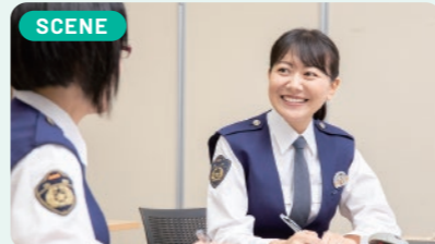
私が採用された当時と比較しても女性職員が非常に増えました。女性同士のコミュニケーションも取りやすくなり働きやすい環境になりましたね。

幼稚園児の時に交通安全教室に来てくれた警察官にあこがれたのが、きっかけでした。その後は将来を漠然としか考えていませんでしたが、高校の就職説明会に訪れた警察官を見て、昔の想いが甦りました。祖母からも「昔なりたがっていたね」と背中を押してもらったこともあり、警察官採用試験にチャレンジ!今に至っています。