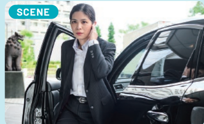
警護のやりがいには「何もなく終わること」。当たり前のように聞こえますがそのために全神経を注ぎますので、無事に終わると本当にホッとします。

体力に自信はありませんでしたが、警察学校で仲間と励まし合いながら訓練に臨んだことが思い出深いです。交番勤務は思っていたよりも多様な事案があり、今まで過ごしてきた世界とは違うと驚きの連続でした。最前線で人助けに携われることにやりがいを感じましたね。