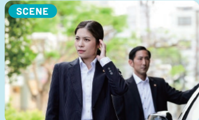
前職を退職した後、採用説明会に参加した際にいた警護員の姿がとても格好良く、26歳のときに警察官になろうと決めました!

以前は児童養護施設で働いていました。再就職を考えた際に採用説明会で出会った、国内外の要人の身辺を守る「警護」員に憧れたことが率直な理由です。また、児童養護施設勤務では対応できなかった事案も警察官になればできるのでは…という思いもありました。人を、子どもを守る仕事がしたいと思い採用試験を受験しました。