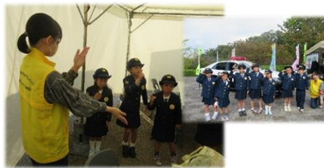
10月15日（日曜日） 西和警察署主催「第12回馬見フラワーフェスタ」