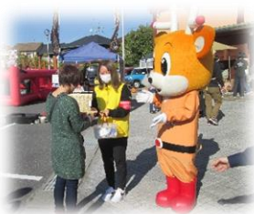
11月26日（日曜日） 桜井警察署主催「つながるマルシェ in 桜井」