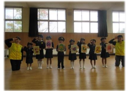
11月23日（木曜日、祝日） 西和警察署主催「家族参加型～遊んで・楽しんで～集まれ！はたらくのりもの」