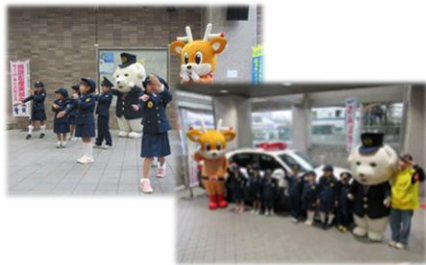
10月8日（日曜日） 西和警察署主催「リーベる王寺防犯フェア」

上半期に引き続き、県下の警察署が実施する各種街頭啓発活動に参加し、チーム『キッズポリス』による啓発の支援も行いました。